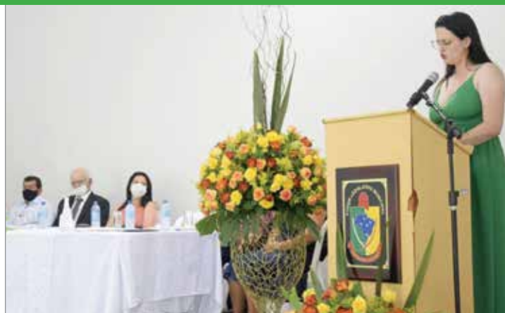
Discurso da prefeita Mayara Tafuri durante a solenidade de posse, ocorrida no dia 1º de janeiro