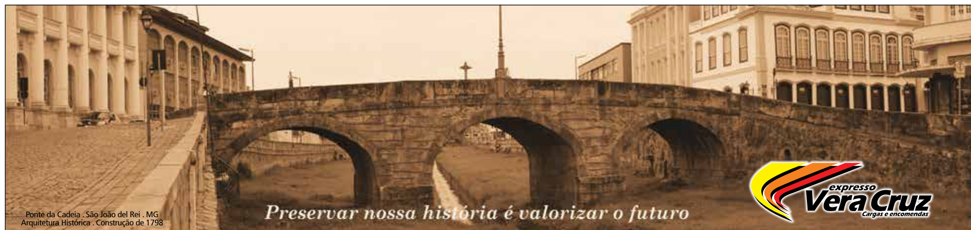
Ponte da Cadeia - São João del Rei - MG Arquitetura Histórica - Construção de 1798