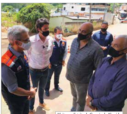
Visita ao distrito de Correia de Almeida

A pedido do deputado, o governador esteve também no distrito de Correia de Almeida para verificar os estragos provocados pelas chuvas que caíram entre os dias 12 e 13 de janeiro. O governador afirmou que iria avaliar formas de apoiar a recuperação do distrito e o auxílio aos atingidos, em parceria com a Secretaria de Assistência Social do município.