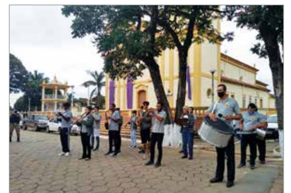
Apresentação da Lira Santo Antônio em comemoração ao aniversário de Ibertioga

No dia 1º de março, data em que Ibertioga foi emancipada (no ano de 1963), houve alvorada festiva com a Lira Santo Antônio e hasteamento da bandeira com a presença de autoridades, inclusive ex-prefeitos que também prestaram suas homenagens à cidade.