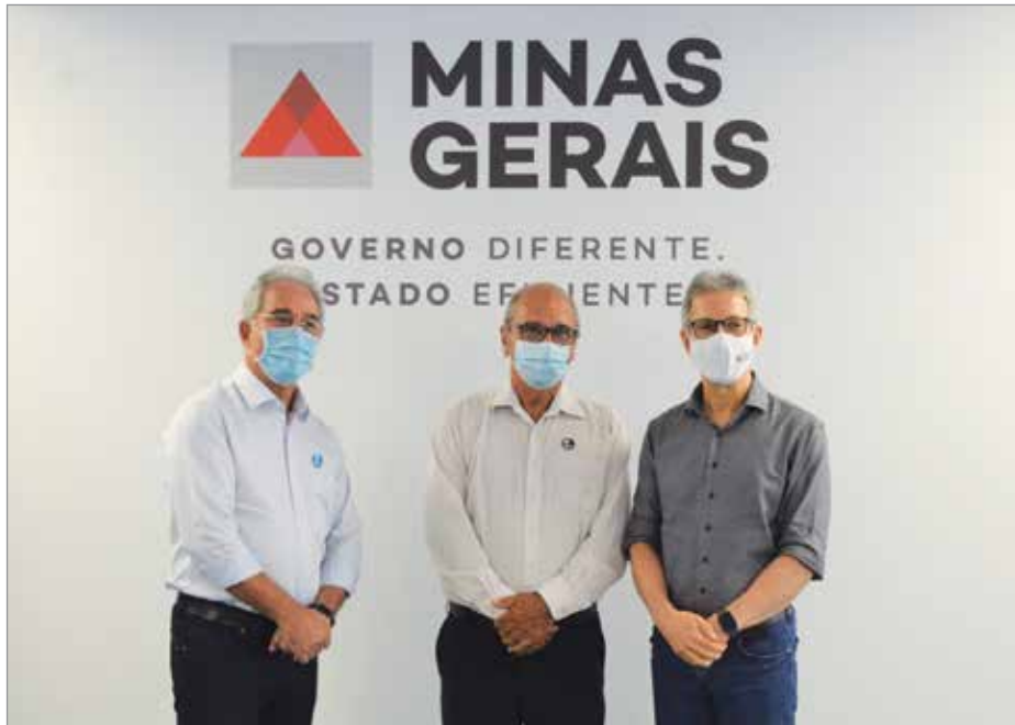
Deputado estadual Duarte Bechir e o prefeito Cabaço com o governador Romeu Zema durante encontro em BH

O principal assunto tratado, mais uma vez, foi o pedido de pavimentação da MG-338, trecho que liga Piedade à Ibertioga. Cabaço expôs ao governador que o asfaltamento é urgente e extremamente importante não só para Piedade mas para toda a região e, que a realização da obra traria impactos positivos imediatos na mobilidade da população, no escoamento da produção agropecuária - que segue em franco crescimento no município - e na economia como um todo. Na oportunidade, Cabaço ainda relatou ao governador que a população tem sofrido cada vez mais com o estado