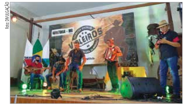
A live do Encontro de Violeiros está disponível por tempo indeterminado na página do Facebook da Secretaria de Cultura e Turismo de Ibertioga

Este ano, os ibertioganos não puderam participar de festas no aniversário da cidade, comemorado em 1º de março. Mas a administração municipal celebrou a data como foi possível em tempos de pandemia. As homenagens começaram em 28 de fevereiro, com missa celebrada pelo pároco do município, Padre Márcio, e também uma live do Encontro de Violeiros, evento que já encantou e alegrou tantos ibertioganos.