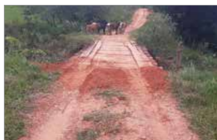
A Secretaria de Obras de Ibertioga atende a diferentes demandas: pontes e mata-burros estão sendo reformados