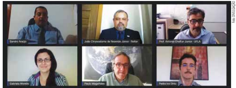
A formalização ocorreu por meio de evento on-line com a participação de representantes da UFLA e da Universidade do Porto, Portugal

O movimento busca congrega cientistas, especialistas jurídicos, socioeconomistas, estados soberanos, ONGs, organizações internacionais, autoridades locais, comunidades locais, povos indígenas, indivíduos, academia e outras partes interessadas. Tem o apoio do Ministério do Ambiente de Por-