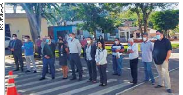
Autoridades municipais, integrantes do Sicoob e convidados durante inauguração