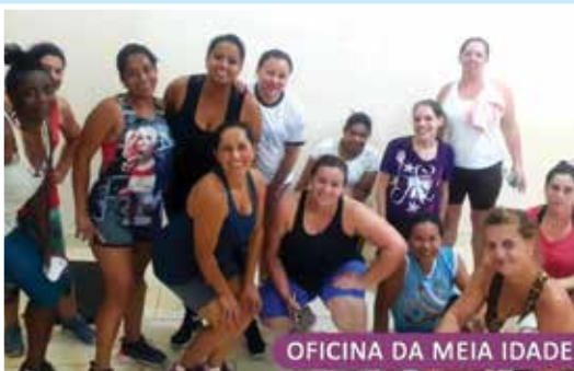
OFICINA DA MEIA IDADE