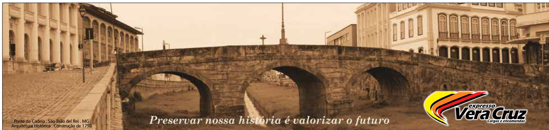
Ponte da Cadeia - São João del Rei - MG Arquitetura Histórica - Construção de 1798

Preservar nossa história é valorizar o futuro