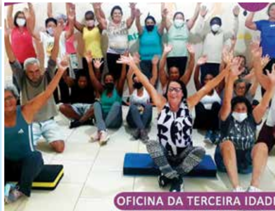
OFICINA DA TERCEIRA IDADE