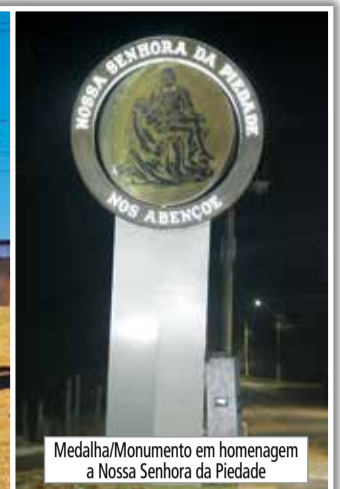
Medalha/Monumento em homenagem a Nossa Senhora da Piedade