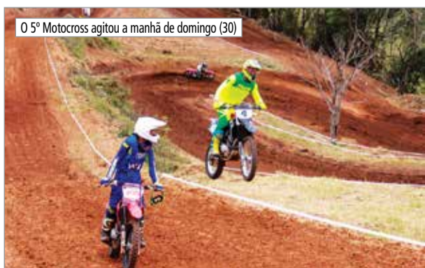
O 5º Motocross agitou a manhã de domingo (30)