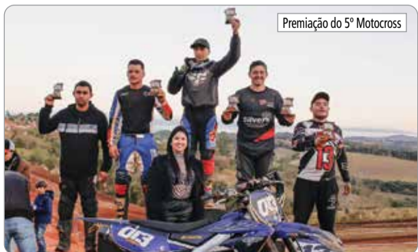
Premiação do 5º Motocross