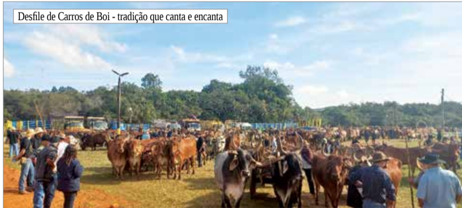
Desfile de Carros de Boi - tradição que canta e encanta

to às Mães e que ainda hoje tem parte de sua renda voltada para ajudar na manutenção do mesmo. Além disso, impulsiona e fortalece a economia local, com destaque para o comércio, hotelaria, cultura e muito mais.