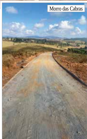
Morro das Cabras