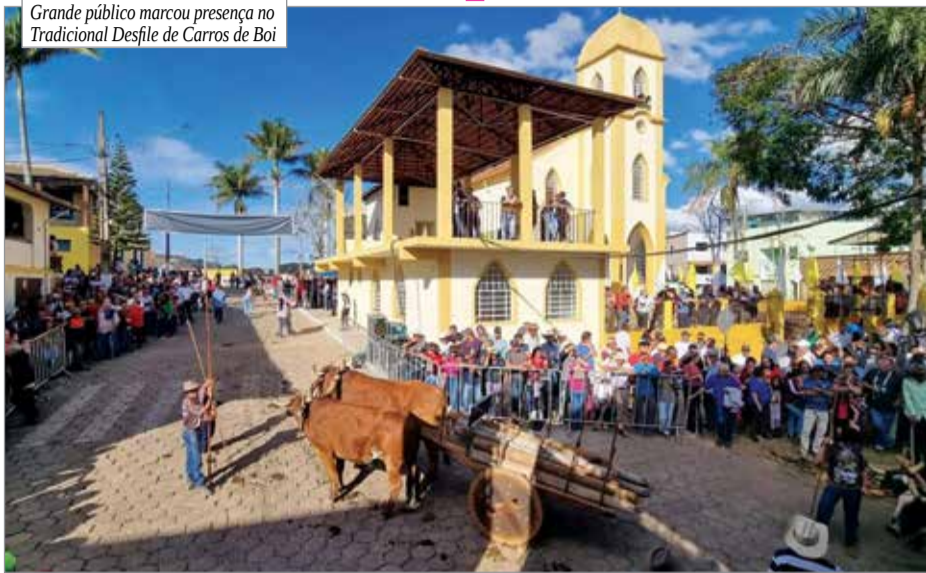
Grande público marcou presença no Tradicional Desfile de Carros de Boi