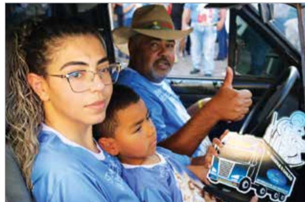
XV Desfile e Leilão Motorizado em homenagem a São Cristóvão, protetor dos motoristas