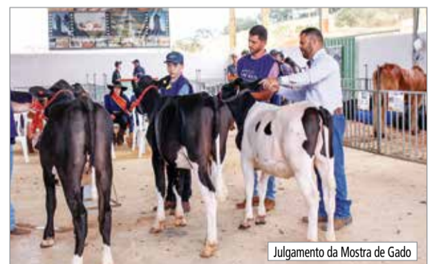
Julgamento da Mostra de Gado