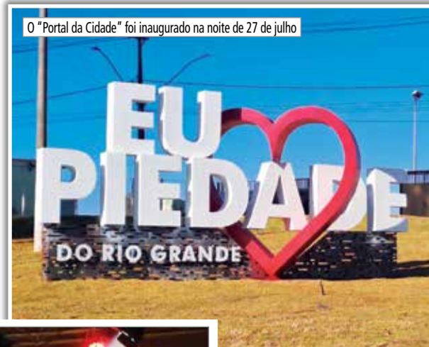
O “Portal da Cidade” foi inaugurado na noite de 27 de julho

porque a Rural Fest é uma das festas mais aguardadas da região. A receita do sucesso certamente passa pela variedade e intensidade da programação que sempre atrai e conquista os mais variados públicos. Parabenizamos todos os envolvidos na organização e realização da 12ª Rural Fest!