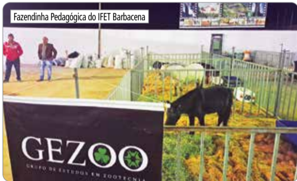
Fazendinha Pedagógica do IFET Barbacena