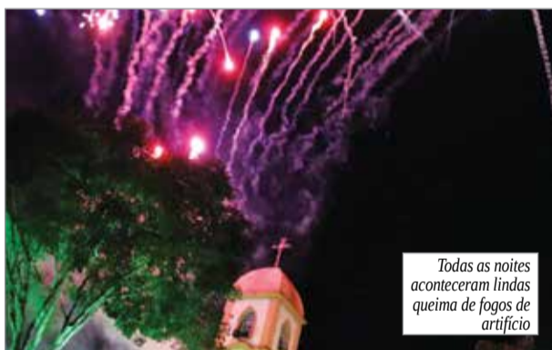
Todas as noites aconteceram lindas queima de fogos de artifício

do lugar onde fui batizado”, frisou padre Ailton.