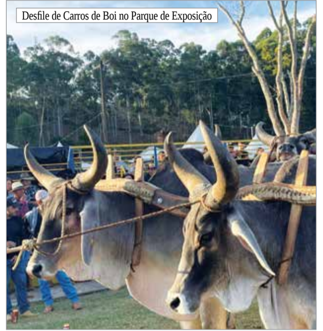
Desfile de Carros de Boi no Parque de Exposição