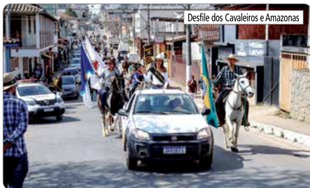
Desfile dos Cavaleiros e Amazonas