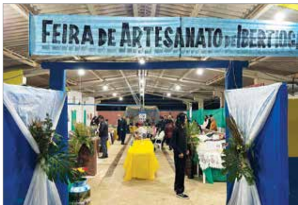
FEIRA DE ARTESANATO DE IBERTIOGA

Texto: Assessoria de Comunicação da Prefeitura Municipal de Ibertioga