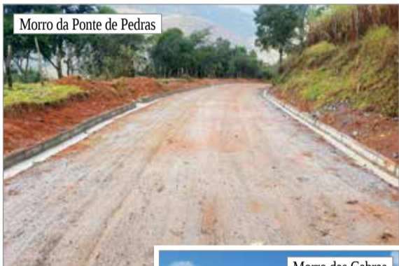
Morro da Ponte de Pedras

Sempre pensando no bem-estar da população, a administração tem trabalhado fortemente com sólidas parcerias e apoio irrestrito da Câmara Municipal para melhorar a vida das pessoas.