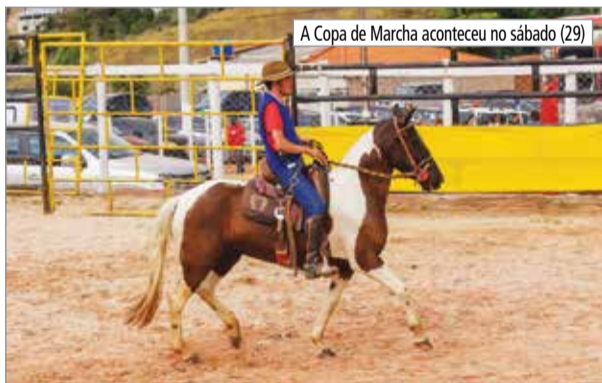
A Copa de Marcha aconteceu no sábado (29)

Vieira encerrou a Rural Fest 2023 com uma grande apresentação.