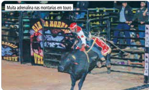
Muita adrenalina nas montarias em touro