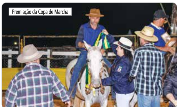
Premiação da Copa de Marcha