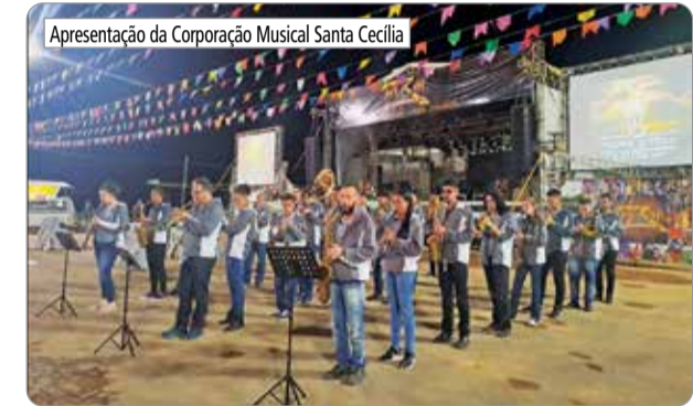
Apresentação da Corporação Musical Santa Cecília