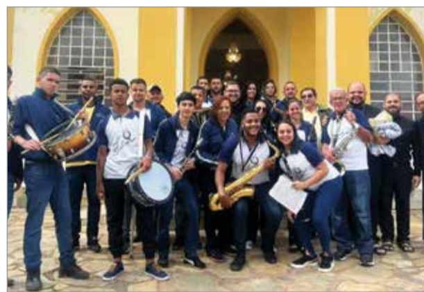
A Corporação Musical Lira Santanense realizou belas apresentações durante a festa