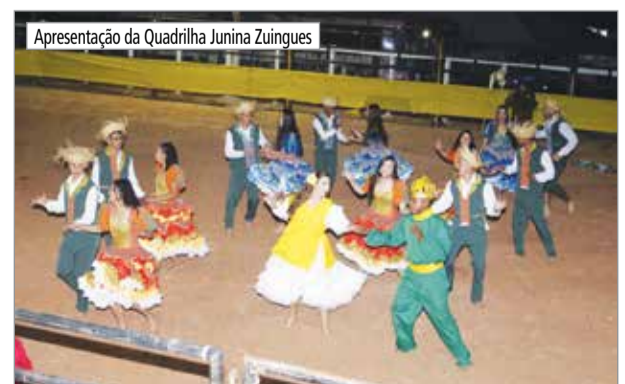
Apresentação da Quadrilha Junina Zuingues