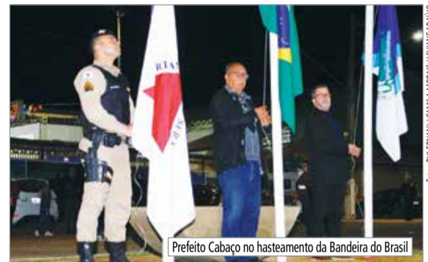
Prefeito Cabaço no hasteamento da Bandeira do Brasil