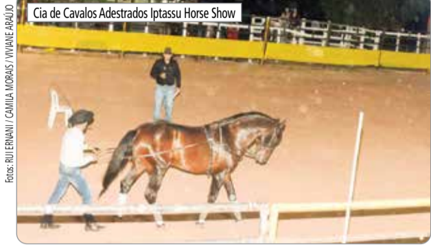
Cia de Cavalos Adestrados Iptassu Horse Show