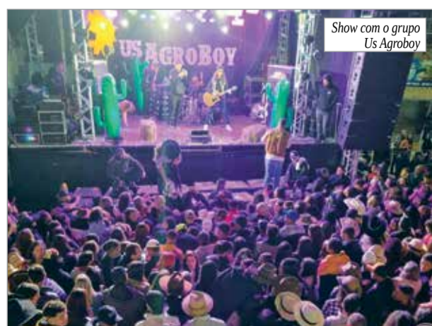
Show com o grupo Us Agroboboy