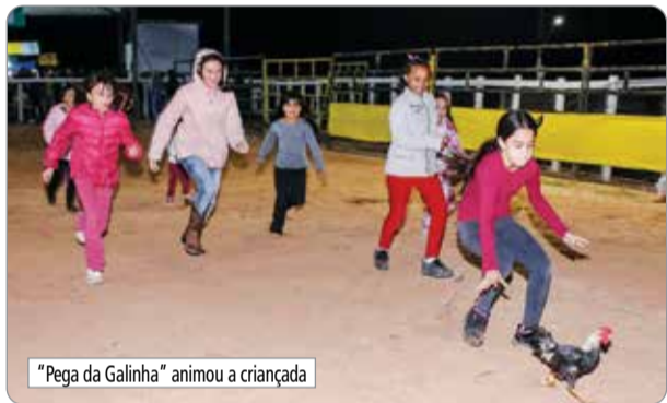
"Pega da Galinha" animou a criançada