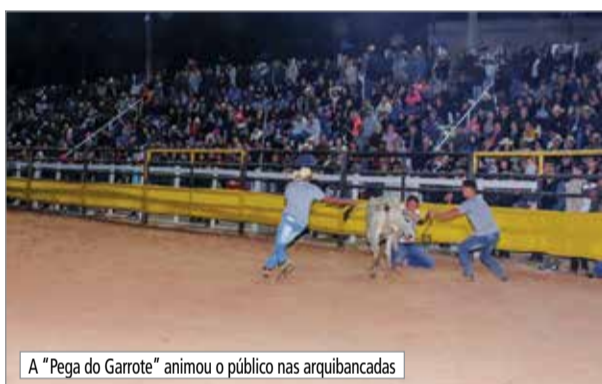
A “Pega do Garrote” animou o público nas arquibancadas