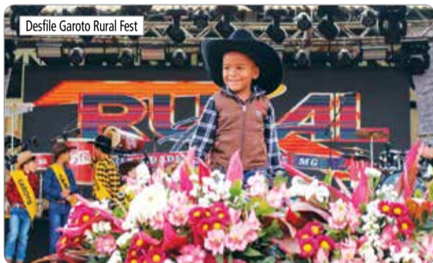
Desfile Garoto Rural Fest