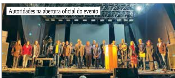
Autoridades na abertura oficial do evento