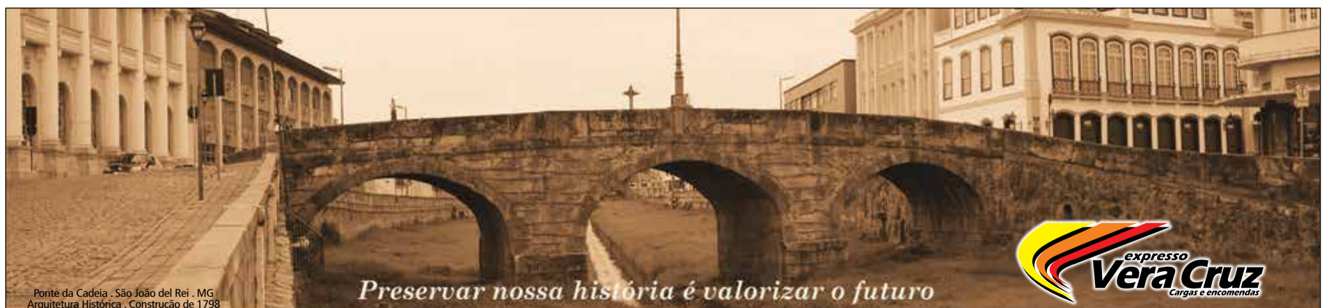
Ponte da Cadeia - São João del Rei - MG Arquitetura Histórica - Construção de 1798

Preservar nossa história é valorizar o futuro