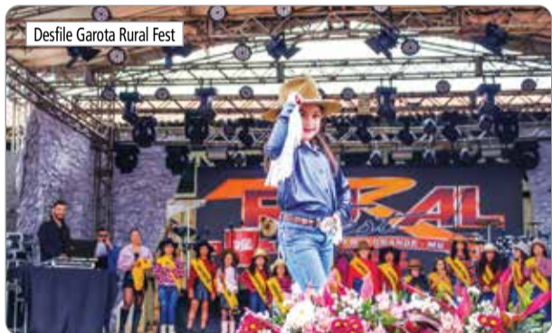
Desfile Garoto Rural Fest