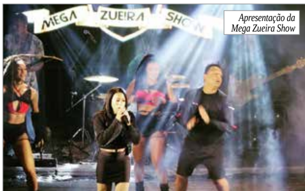
Apresentação da Mega Zueira Show