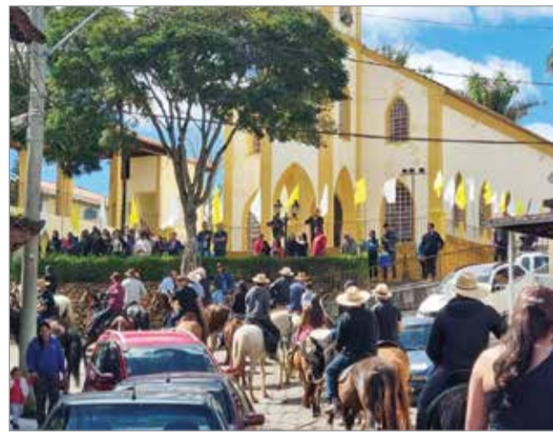
Cavalgada em homenagem a São Francisco de Assis

cem ter a nossa tradição de fé e cultura mantidas, com Desfile de Carros de Boi, apresentações da Corporação Musical Lira Santanense, Congado e Moçambique, Queima de Fogos em frente à Igreja... e, por isso, estamos ansiosos para a edição 2024 da Festa de Sant’Ana”, afirmou.