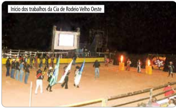
Início dos trabalhos da Cia de Rodeio Velho Oeste