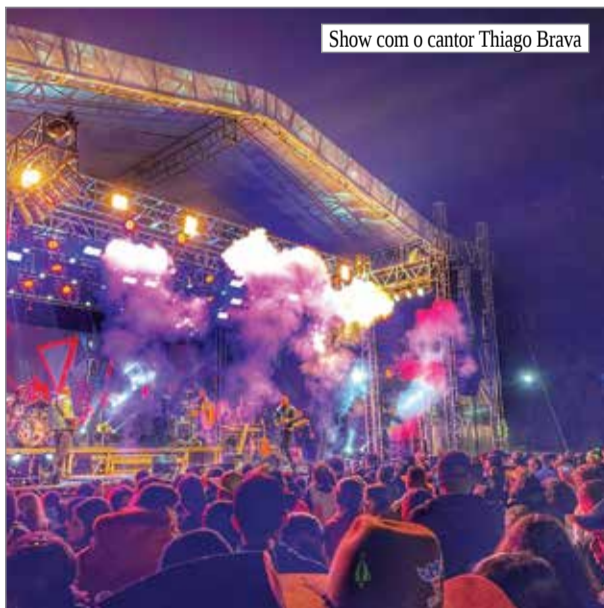
Show com o cantor Thiago Brava