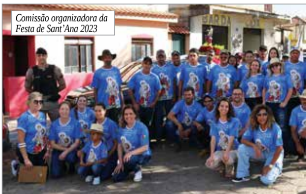
Comissão organizadora da Festa de Sant’Ana 2023