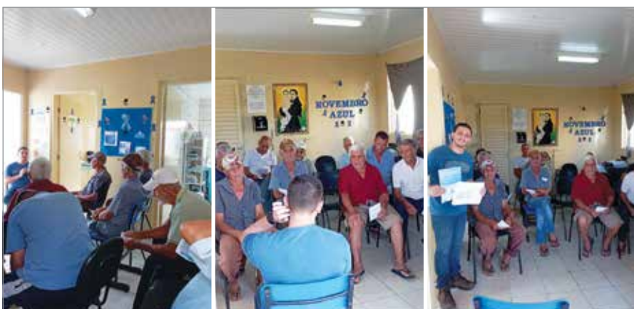
Equipe Dona Zainha realiza ação de educação continuada com o tema Novembro Azul na comunidade de Santo Antônio do Porto