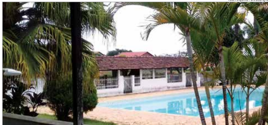
Após vários anos com as atividades paralisadas, o Ibertioga Tênis Clube voltará a funcionar