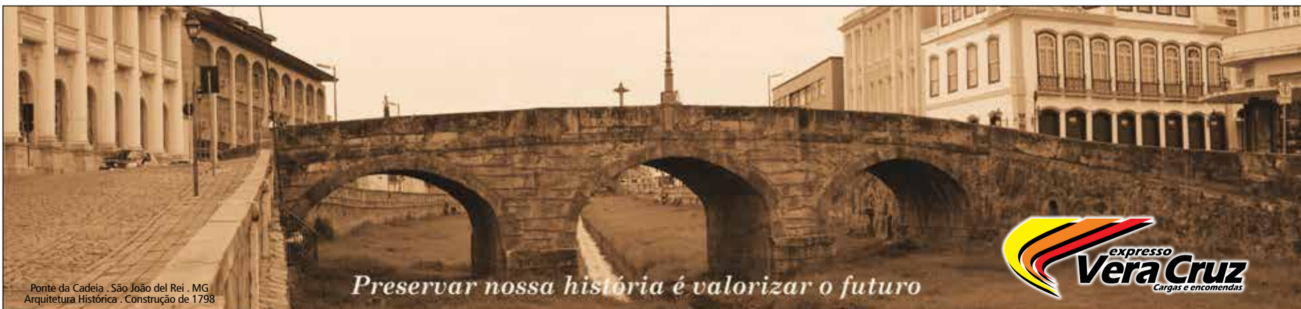
Ponte da Cadeia - São João del Rei - MG Arquitetura Histórica - Construção de 1798

Preservar nossa história é valorizar o futuro