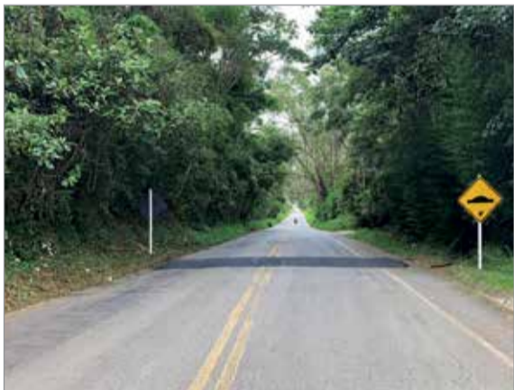
Implantação de quebra-molas na MG-135, próximo a Sá Fortes

No caso da MG-135, o DER iniciou, imediatamente após a visita, intervenções paliativas para melhorar a segurança da MG-135, próximo a Sá Fortes, onde uma erosão colocava em risco todos aqueles que trafegavam da rodovia. “Neste caso, já foi executado, na última semana de novembro, um alargamento provisório, sinalização e implantação de dois quebra-molas para reduzir a velocidade”, explica o deputado. Depois do período das chuvas, ressalta, o DER assumiu o compromisso de iniciar o processo para recomposição efetiva do trecho.