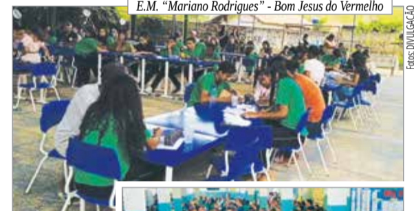
E.M. "Mariano Rodrigues" - Bom Jesus do Vermelho

As escolas da Rede Municipal proporcionaram um encontro dos estudantes com os familiares numa descontraída tarde de agradecimento, reflexão e diversão, fortalecendo a relação e integração que favorecem o sucesso da educação. Agradecemos imensamente a parceria, pois sabemos o significado dela para um futuro promissor do estudante.