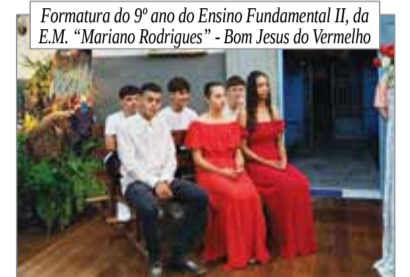
Formatura do 9º ano do Ensino Fundamental II, da E.M. "Mariano Rodrigues" - Bom Jesus do Vermelho