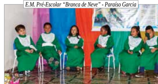
E.M. Pré-Escolar "Branca de Neve" - Paraíso Garcia

de cada estudante a esperança em um futuro melhor. Parabéns aos formandos!