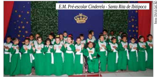
E.M. Pré-escolar Cinderela - Santa Rita de Ibitipoca

Também aconteceu a solenidade de formatura dos estudantes do 9º ano do Ensino Fundamental II, da Escola Municipal Mariano Rodrigues, com uma Missa em Ação de Graças e logo após a entrega dos certificados. Foram momentos de imensa alegria, pelo qual pode-se perceber no olhar