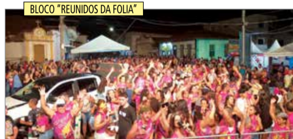
BLOCO "REUNIDOS DA FOLIA"