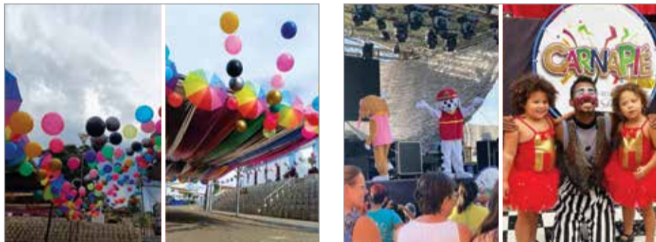
O CarnaPié manteve a tradição de ser um dos maiores e melhores carnavais da região