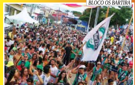
BLOCO OS BARTIRA