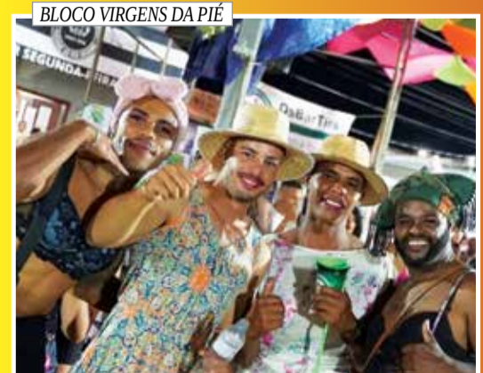
BLOCO VIRGENS DA PIÉ