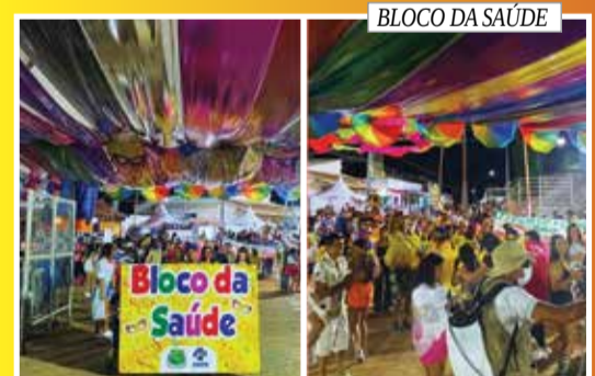
BLOCO DA SAÚDE