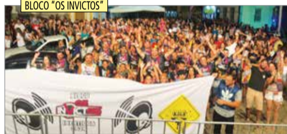
BLOCO "OS INVICTOS"