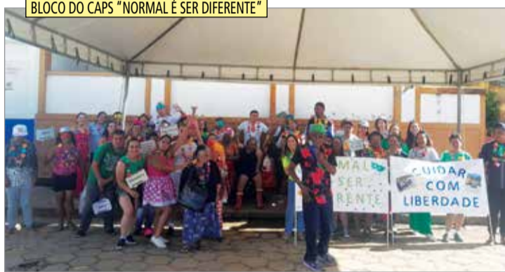
BLOCO DO CAPS "NORMAL É SER DIFERENTE"