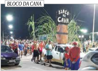
BLOCO DA CANA