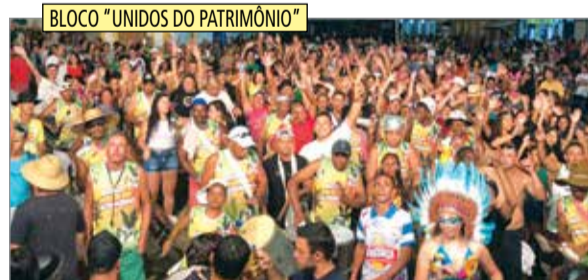
BLOCO "UNIDOS DO PATRIMÔNIO"