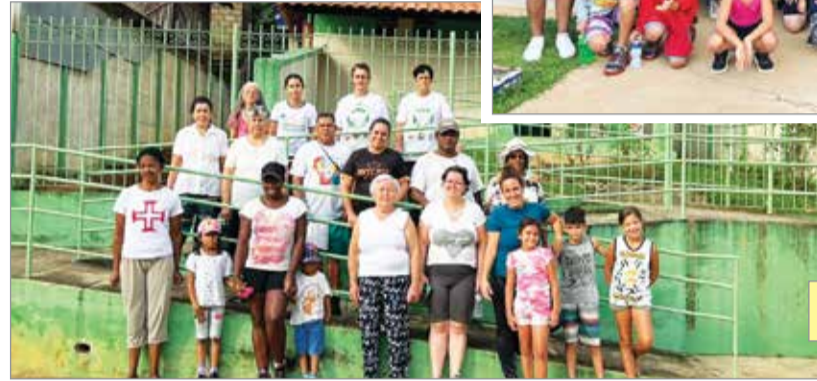
CAMINHADA PÉ NO CHÃO BOM JESUS DO VERMELHO