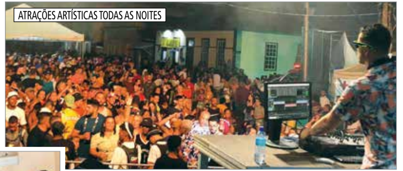
ATRAÇÕES ARTÍSTICAS TODAS AS NOITES

Entre confetes e serpentinas nascem amizades que duram a vida inteira. “Em Ibertioga o Carnaval é a arte de ser feliz e fazer você sorrir”.