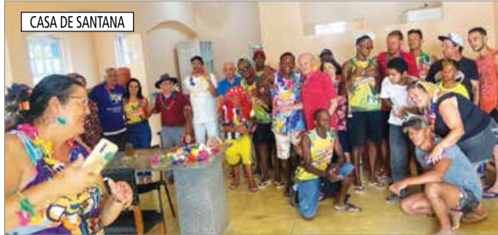
CASA DE SANTANA