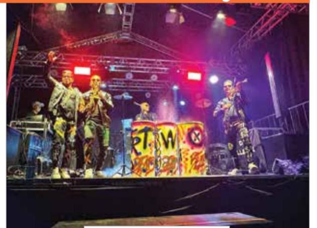
Two Beats Live animou a festa da na segunda-feira no Carnabéu 2024