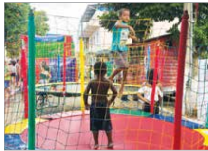
Prefeitura ofereceu um Carnaval incrível para a criançada, repleto de brinquedos gratuitos