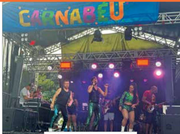
A Elétrica Banda Show animou a tarde do Carnaval em Santana do Garambéu