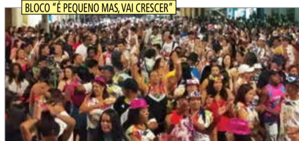
BLOCO "É PEQUENO MAS, VAI CRESCER"