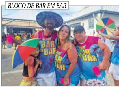
BLOCO DE BAR EM BAR