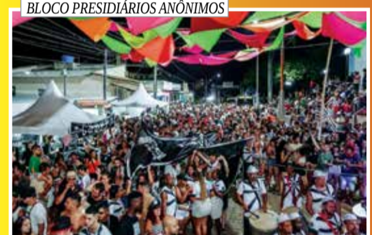
BLOCO PRESIDÁRIOS ANÔNIMOS