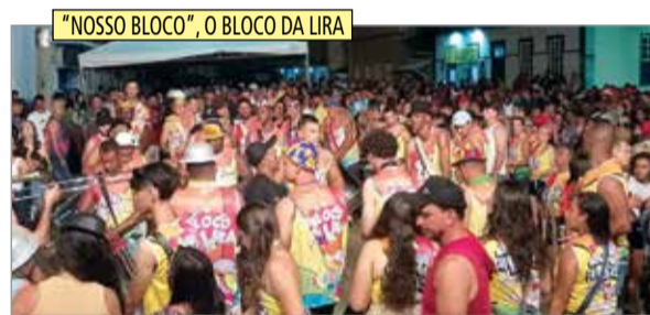
"NOSSO BLOCO", O BLOCO DA LIRA