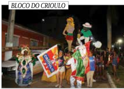
BLOCO DO CRIOULO