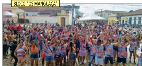
BLOCO "OS MANGUAÇA"