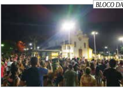
BLOCO DA MADRUGADA