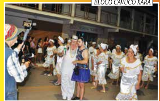
BLOCO CAVUCO XARÁ