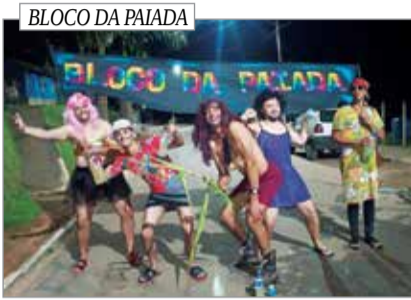
BLOCO DA PAIADA