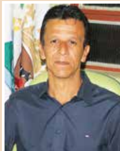
Deley - 04/03