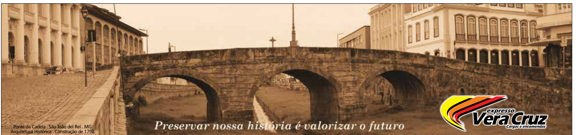
Ponte da Cadeia - São João del Rei - MG Arquitetura Histórica - Construção de 1798

Preservar nossa história é valorizar o futuro