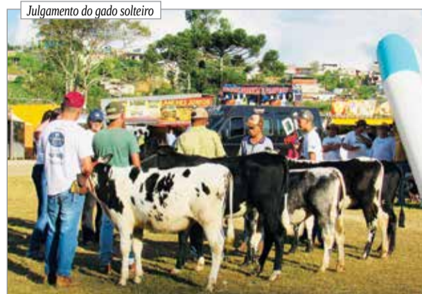
Julgamento do gado solteiro