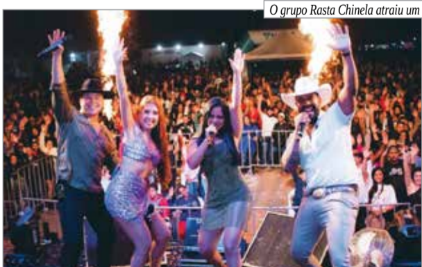
O grupo Rasta Chinela atraiu um grande público na noite de sábado (27)